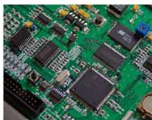
高速CPU的独立控制单元