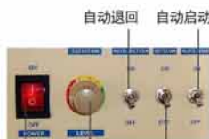
电源 灵敏度调节 红外线开关