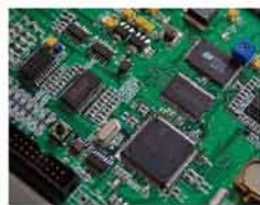
高速CPU的独立控制单元