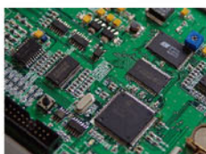
高速CPU的独立控制单元